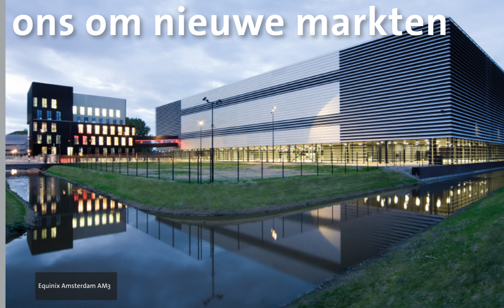
Equinix Amsterdam AM3